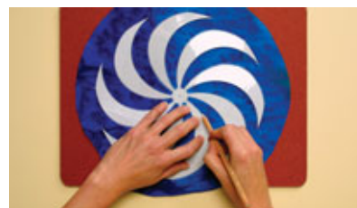
Den Umriß der Schablone sorgfältig nachzeichnen.