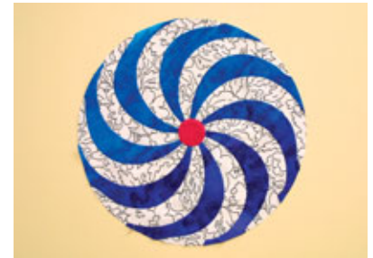
Das fertige Mittelmotiv