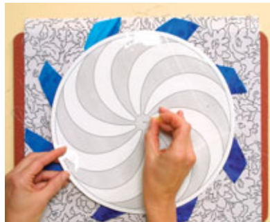
Schablone C mittig auf dem Block ausrichten.