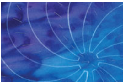
Die Windradflügel festheften.