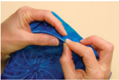
Das Windrad mit den Fingern kniffen.